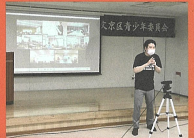
▲実践を交えながらコーディネーショントレーニングを教えてくださいました。

また、第二部では、近隣の3校が集まり、小学校副校長会、中学校副校長会、小学校PTA連合会、中学校PTA連合会、青少年委員の「五者」でディスカッションを実施しました。会場を分けることで対面での交流が可能となり、近隣校とのつながりや五者のつながりを再確認する貴重な時間となりました。