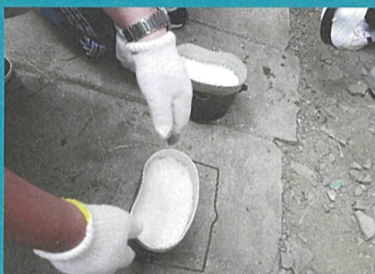
▲ご飯が上手に炊けました！レトルトカレーをかけて美味しくいただきました。