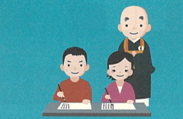
▲写経 集中して書き上げた写経は納経し、本堂で祈願法要を行いました。