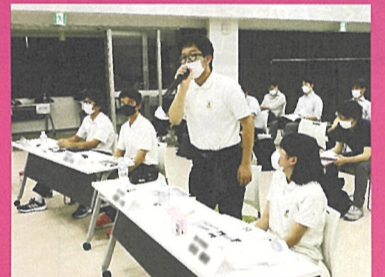
▲意見交換も活発に行われました。