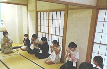
▲茶道 お菓子の食べ方やお茶の飲み方を学びました。