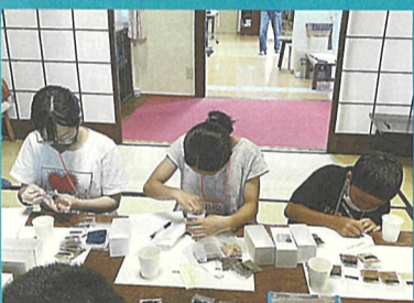
▲香道 調合に苦戦しながらも匂い袋を作成しました。