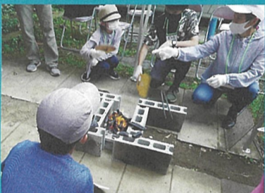
▲班ごとに1つの火起こし場を担当し、うちわで扇ぎながら火起こし。

勉強だけでなく、お寺という非日常の場所で、日本文化を体験するプログラム(茶道・香道・写経・座禅など)様々な体験をすることができました。