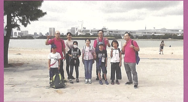
▲都内ウォーキング