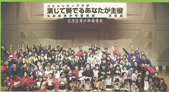
▲▼令和元年度開催の様子

文京区在住・在学・在勤の青少年を対象に、表現活動の内容を広く区民に発表する場を提供しています。「演じて奏でるあなたが主役」を合言葉に、楽器演奏・歌・ダンス・プレゼンテーション等、日頃の活動の成果が存分に発揮でき、参加者全員が達成感を得られるような運営を心掛けています。事業の運営にはb-lab(文京区青少年プラザ)を利用している中高生も、ボランティアとして参加しています。