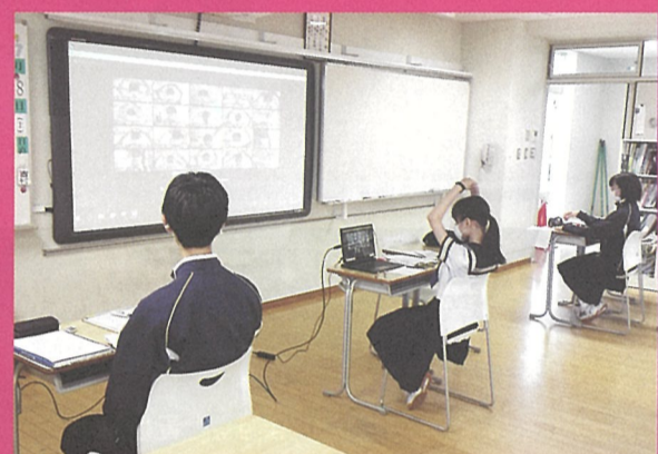
▲令和2年度オンライン開催の様子