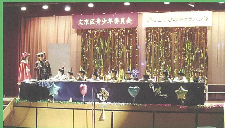
▲令和元年度「クイズ界の“King & Queen” Q太・Q子からの挑戦状」