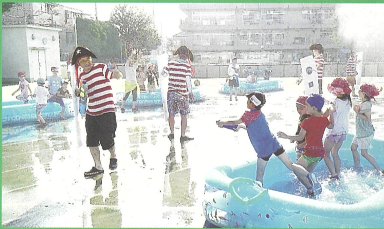
▲令和元年度「小日向ブルーの大海戦」

学校や学年の壁を越えた交流と幅広い学びの機会を提供することを目的に、小学生を対象とした事業を開催しています。近年は低学年児童向け「水遊び大会」(夏開催)と、高学年児童向け「クイズ大会」(秋～冬ごろ開催)の年2回開催しています。参加者は頭脳と体力、チームワークを駆使しながら各競技に挑みます。