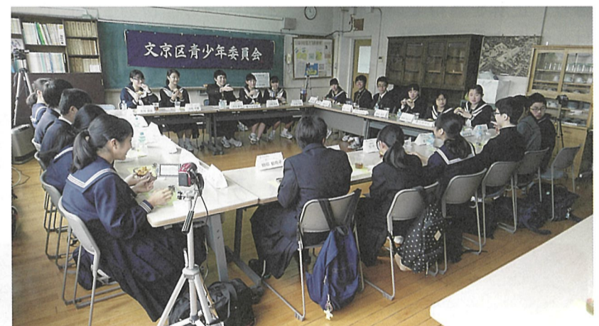
▲ランチサミットではリラックスして話し合いました。