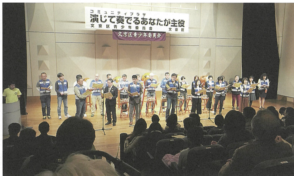
▲青少年委員の合唱で幕を開けました。

今年で24回目となるコミュニティプラザが1月28日(日)にシビックホール小ホールにて開催されました。今回は、出演団体16組、出演総数150人、観客はのべ520人を超える方が集まり、会場は常に熱気に包まれていました。