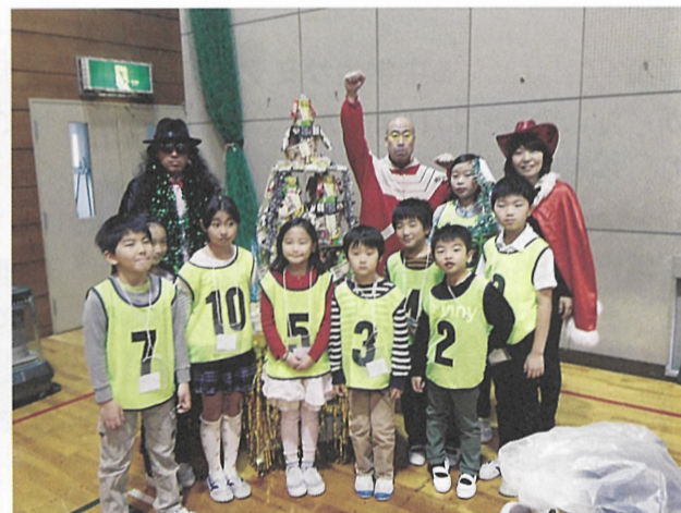
▲優勝チームにはお菓子の特大トロフィーが贈られました。

当日初対面の子どもたちでしたが、クイズが進むにつれて互いに打ち解けていき、声援や相談などでチームワークを発揮する姿が印象的でした。