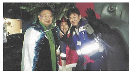
▲道中、青少年委員が変装したモンスターも出現しました。

また不定期に区内に現れる青少年委員(若干の変装あり)を、メールのヒントを参考に探し当てて、ボーナスポイントを獲得するゲームも行い、朝まで楽しく活動することができました。夜の文京区の様子や自分の学校以外の様子を見て回ることによって地域の特徴を知ることができ、また、普段経験できない時間帯に20数キロという非常に長い距離をチームで協力し合いながら歩ききることによって、大きな自信を身につけることができました。今後もより多くの子どもたちにぜひ参加してほしいと思います。