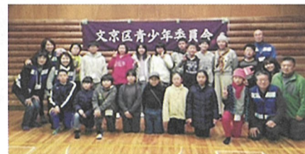
▲朝まで無事に歩ききりました。