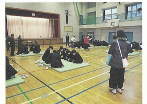
▲ 第八中学校、百人一首大会の様子。