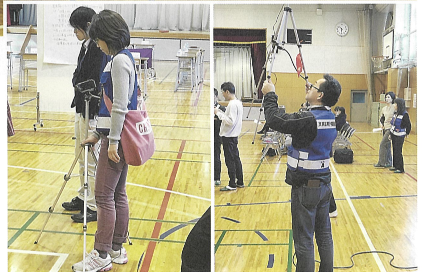
▲当日来られなかった生徒のために、青少年委員が動画を撮影しました。

終了時のアンケートには積極的な意見や感想が多く、今日の会から得たことを実践してみたいといった意欲が伝わってきました。