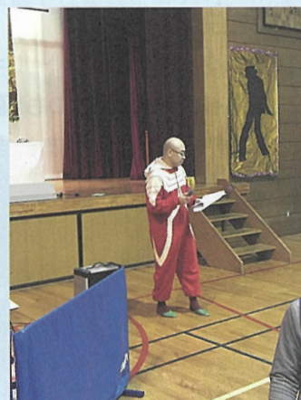
▲リハーサルに余念のない寺門委員