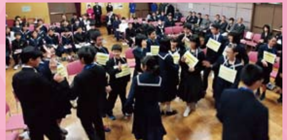
アイスブレイキング：バースデーチェーン

アイスブレイクは初対面の人同士が出会う時に、その緊張をほぐすための手法。集まった人々を和ませ、コミュニケーションがとりやすい雰囲気を作り、目的の達成に向けて積極的に関わってもらえるよう働きかける技術です。自己紹介、誕生日順に並ぶバースデーチェーン、血液型集合では見学の生徒の皆さんも参加し、まさにアイスブレイクした雰囲気になりました。