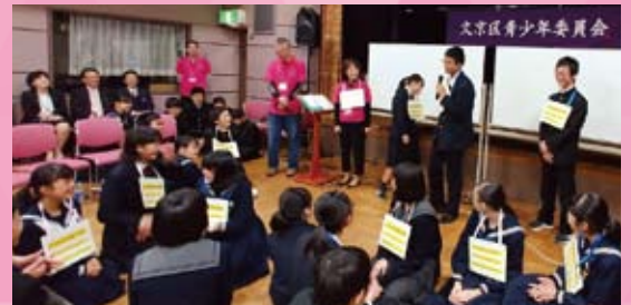
アイスブレイキング：血液型集合