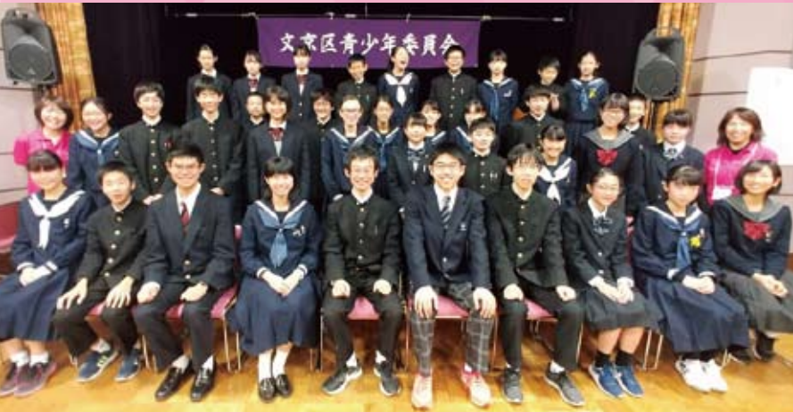
参加者全員で写真撮影