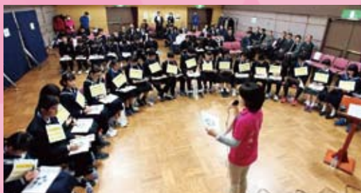
ファシリテーションを学ぶ